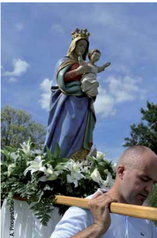
Procession lors de la fête de l'Assomption, à Longpont-sur-Orge (91).